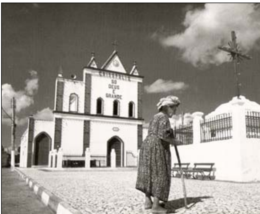
Figura 59. Igreja de Crisópolis, construída pelo Conselheiro. In Teixeira, 1997.