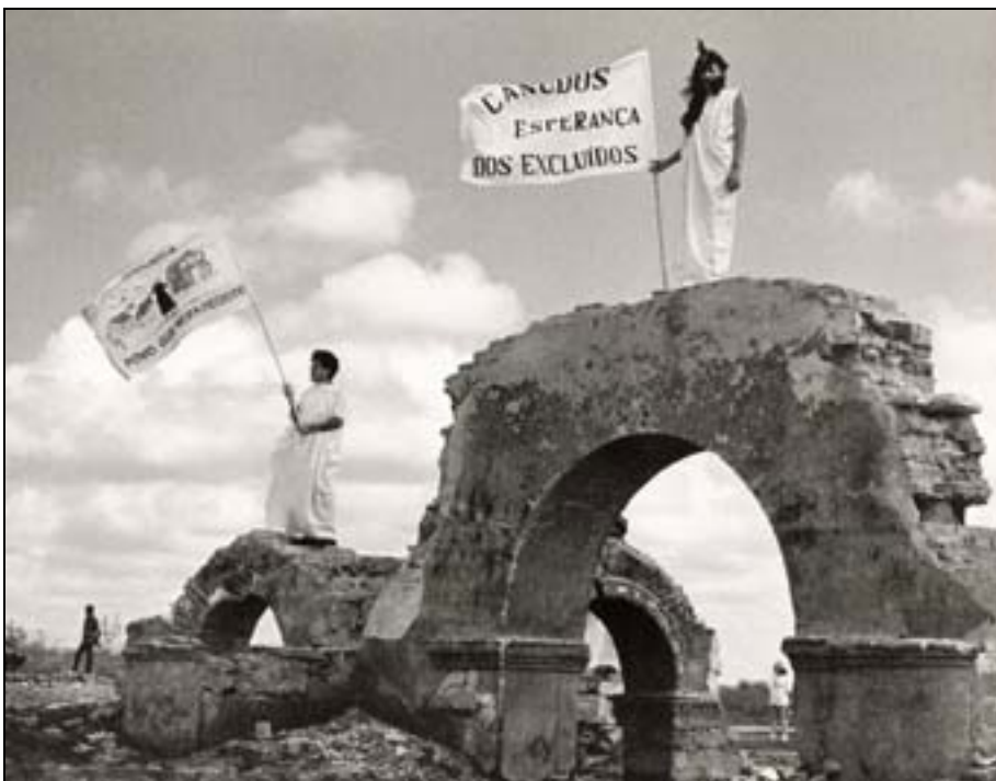
Figura 61. Teatro nas ruínas: homens e mulheres pedem justiça social. In Teixeira, 1997.