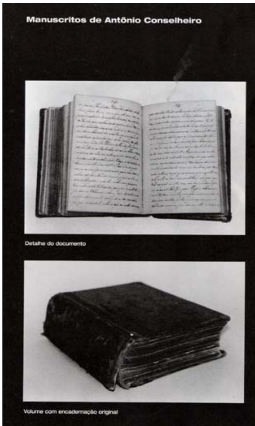
Figura 52. Manuscritos de Antônio Conselheiro. In Martins 2001.