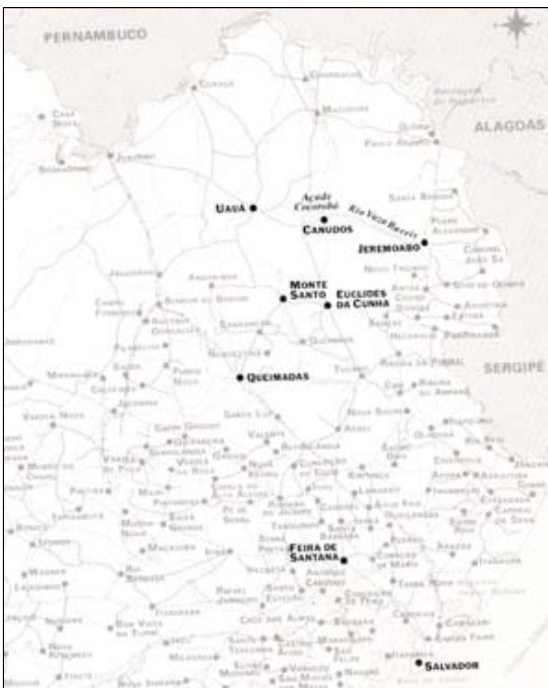
Figura 51. Localização detalhada de canudos. In Teixeira, 1997.