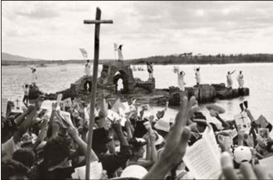
Figura 60. Missa e teatro nas ruínas de canudos. In Teixeira, 1997.