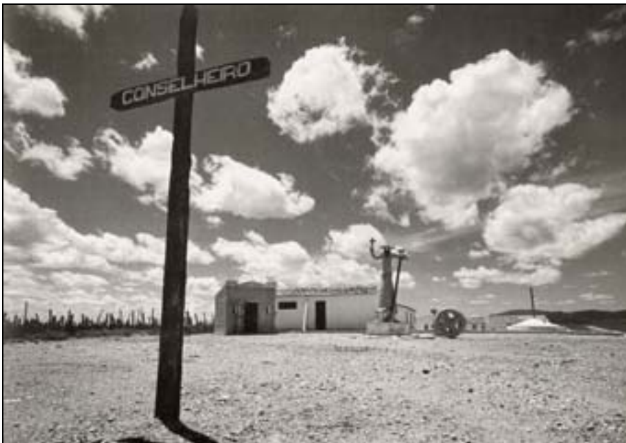
Figura 57. Entrada do Museu de Alto Alegre, BA. In Teixeira, 1997.

Figura 56. A única imagem que se tem de Antônio Conselheiro foi a fotografia feita pelo fotógrafo Flávio de Barros, em 6 de outubro de 1897, data da exumação do cadáver: