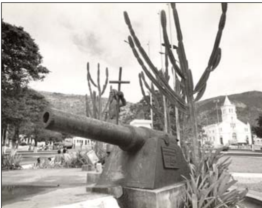
Figura 58. Praça de Monte Santo: a “matadeira”. In Teixeira, 1997.