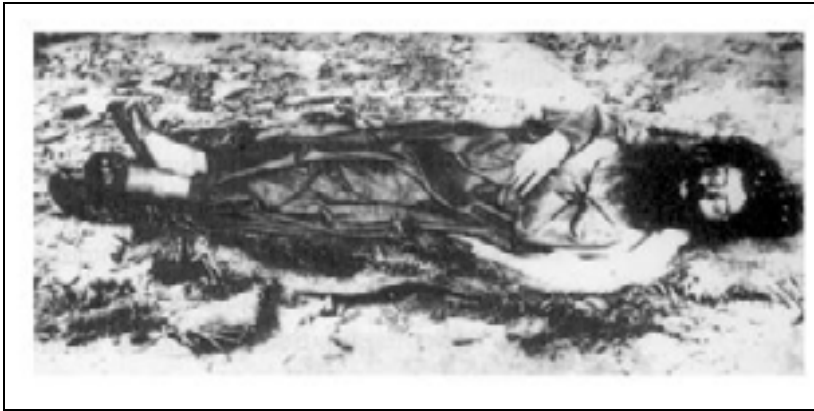
Figura 56. A única imagem que se tem de Antônio Conselheiro foi a fotografia feita pelo fotógrafo Flávio de Barros, em 6 de outubro de 1897, data da exumação do cadáver:

Figura 55. Desenho publicado pela Gazetinha de Porto Alegre em 10/10/1897. In Martins 2001.