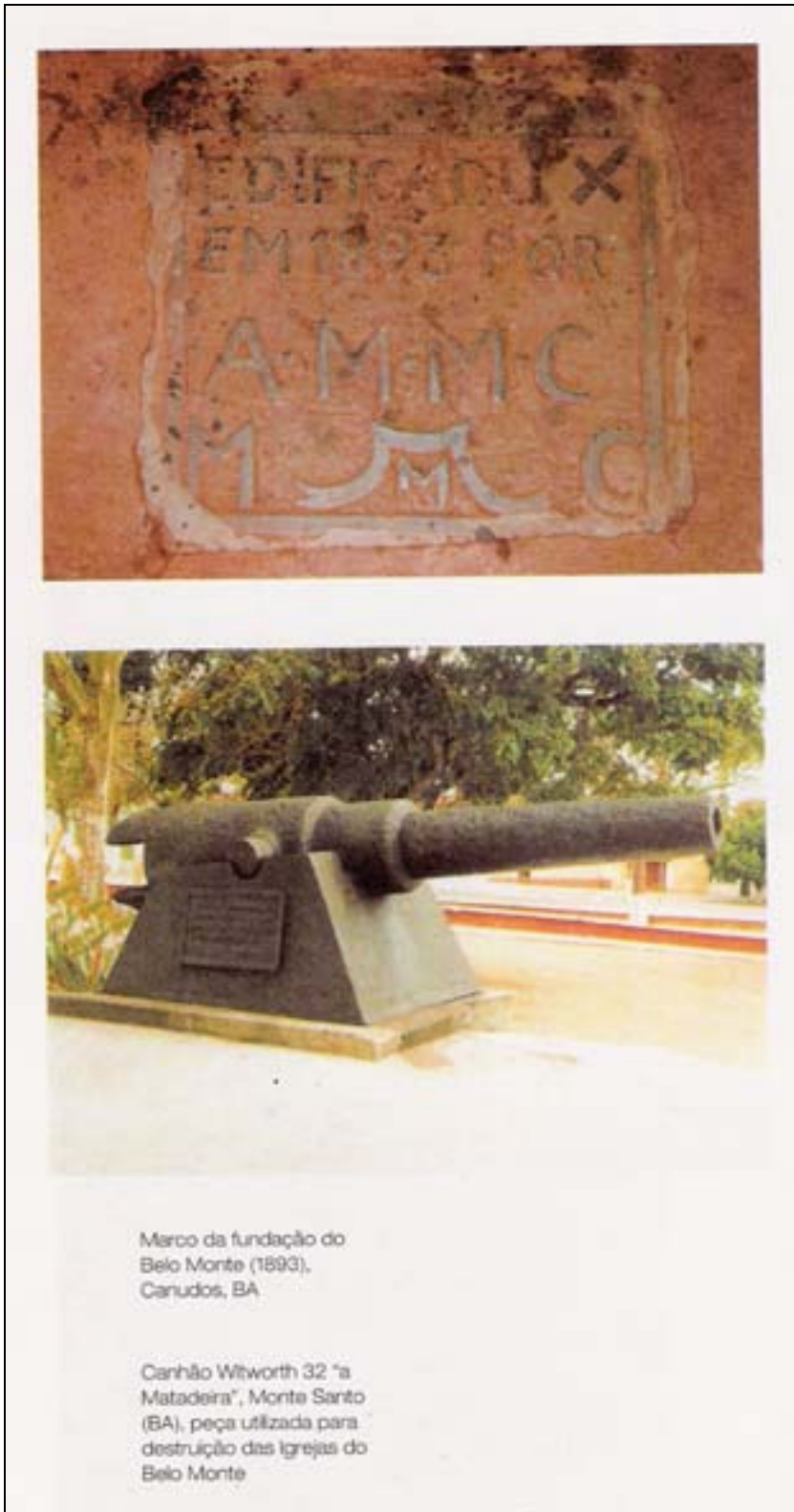
Figura 53. Marco da fundação do Belo Monte a “Matadeira”. In Martins 2001.