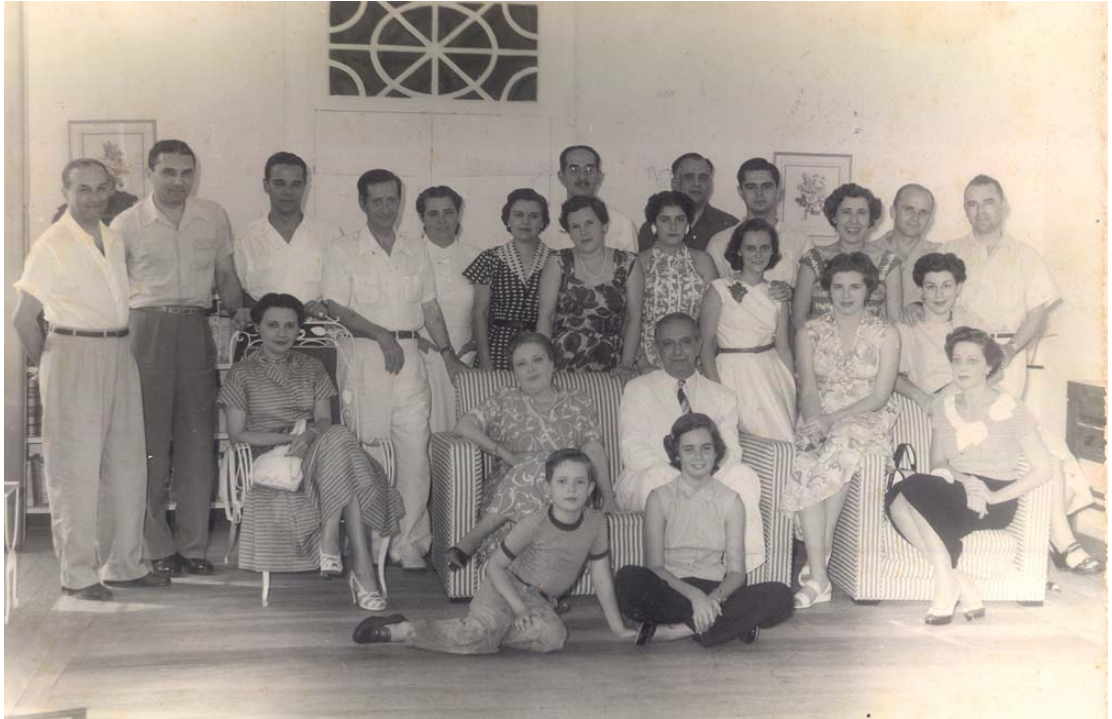
Figura 15 – aniversário de 70 anos comemorado em Resende