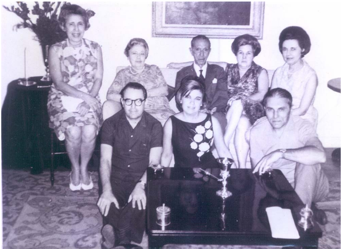
Figura 16 – aniversário de 82 anos