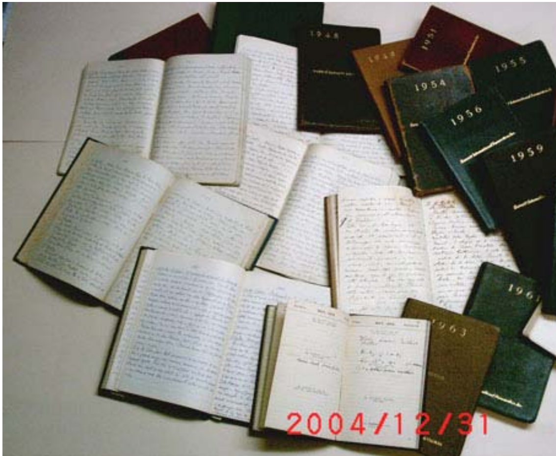
Figura 12 – conjunto dos diários fotografados em 31/12/2004

A caligrafia também vai mudando, embora sempre muito firme, bem desenhada e bastante regular. Escreve sempre com caneta tinteiro azul ou preto e grifa e anota em lápis vermelho (figura 12).