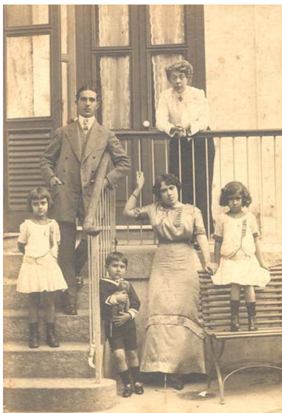
Figura 4 - Retrato da família tirado em 17 de agosto de 1912