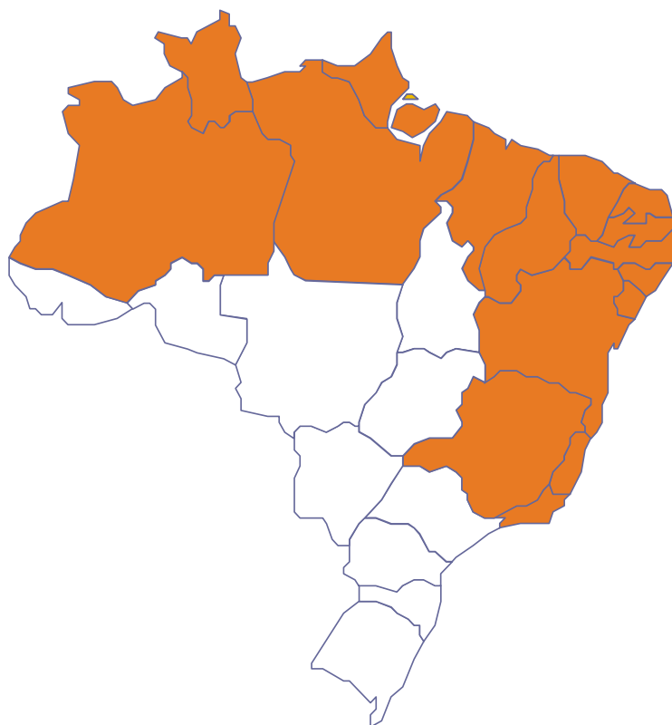
Figura 24

Em 31 de dezembro de 2003, a Oi estava presente em cerca de 592 municípios e, em todos os 16 estados da Região I, correspondendo a 68% da população urbana. Nessa mesma data, aproximadamente 22% dos 93 milhões de habitantes da Região I eram usuários de telefones celulares. A Oi contava com 3,9 milhões de usuários, correspondendo a uma participação de mercado estimada em 18,4%. (Relatório Anual da Oi – Dezembro, 2003)