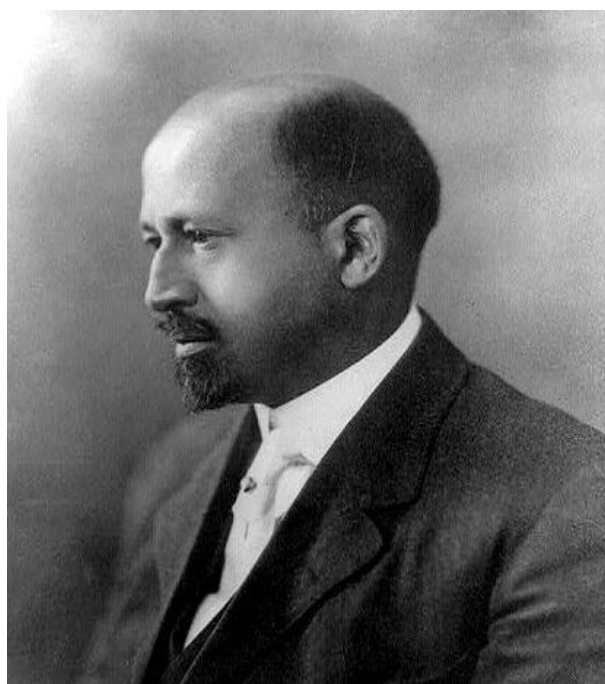
Figura 1 " William E.B. Du Bois, Half-Length Portrait, Facing Left."