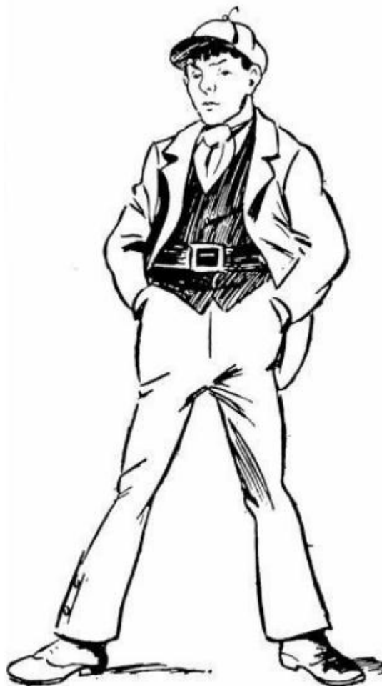
Figura 1 – “Um perfeito Hooligan”

pescoço, um boné colocado jocosamente para frente, bem caído sobre os olhos, e calças muito justas nos joelhos e muito folgadas na altura dos pés”.