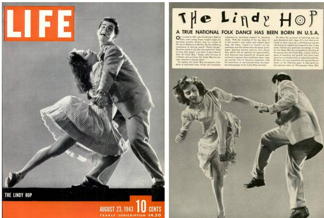
Figura 7 – Lindy hop na capa da revista Life

mulheres que dançar com os soldados era um dever patriótico. Desse modo, como a autora observa, o lindy hop passou a representar mais a liberdade nacional do que a liberdade individual dos negros, tanto que, em 1943, a dança foi tema de um artigo da revista Life intitulado “O lindy hop : uma Verdadeira Dança Folclórica Nacional Nasceu nos EUA” 86 , com dançarinos brancos na foto de capa.