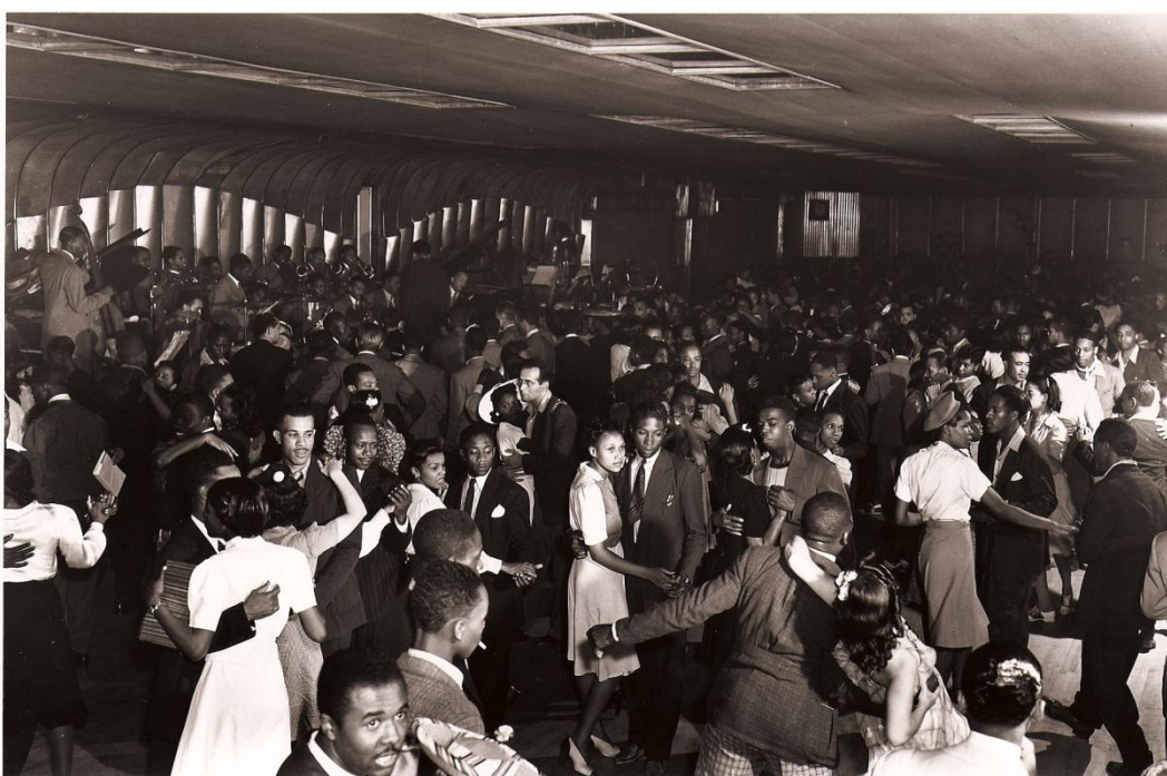
Figura 4 – Savoy Ballroom