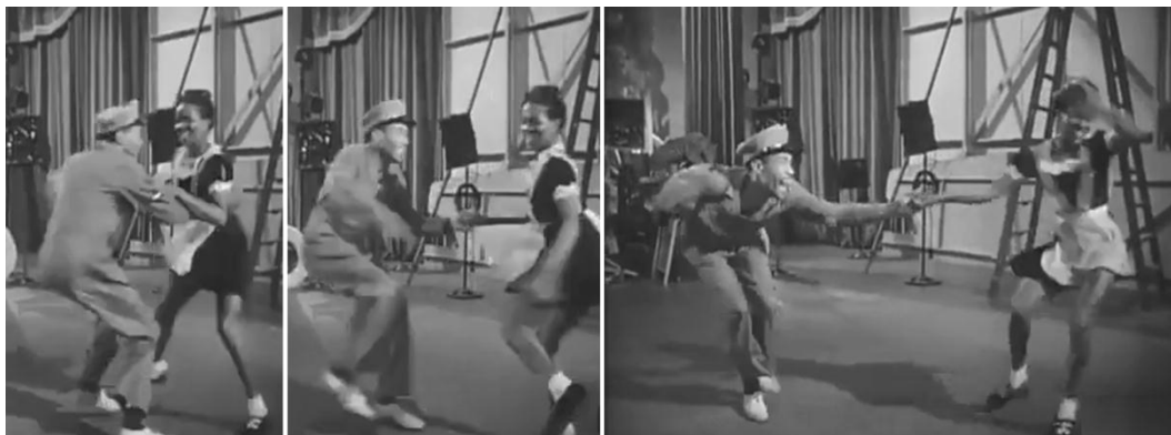
Figura 5 – Swing out Fonte: Hellzapoppin' (1941, EUA, POTTER)

próprios das swing dances (STEVENS; STEVENS, 2011). No swing out , os dançarinos distanciam-se um do outro, ficando conectados por um braço apenas, momento chamado de breakway , no qual podem improvisar antes de retornar novamente para o parceiro (HANCOCK, 2013). Por conta da distância entre os dançarinos e dos largos movimentos de quadris, muitos salões de dança em Nova York fixavam avisos proibindo o swing out (PAINS, 2015). Também era comum que colocassem guardas nas pistas, como uma carta enviada para a coluna “ Voice of the People ”, do Daily News , revela: “Digam, rapazes, somos homens ou ratos? Vamos deixar que guardas nos salões de dança nos digam para parar de dançar lindy hop ?” 73 .