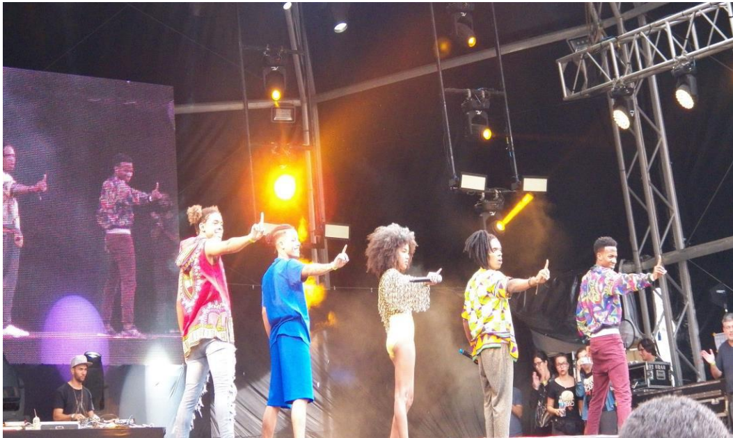
Figura 9 – Dream Team do Passinho

Desse modo, na base da visibilidade conquistada pelo passinho, haveria “um híbrido entre resistência e valorização das raízes e concessões feitas ao sistema em troca da vitrine midiática” (NASCIMENTO, 2017, p. 107). E o mesmo pode ser dito em relação ao funk, de um modo geral. Essa vitrine é importante, pois, quando o funk aparece na mídia, não é apenas uma expressão cultural que está ganhando destaque. Com suas músicas e danças que expõem a realidade dos subúrbios e favelas, milhões de brasileiros, historicamente excluídos, também são projetados no imaginário coletivo. Se, por um lado, a mídia explora o funk, seja por meio da demonização ou da glamourização, por outro, os artistas do funk se apropriam da mídia como um ato de resistência, conquistando uma visibilidade que costuma ser negada aos jovens das periferias. Assim, como Nascimento (2017, p. 112) destaca, “ao invés de calar, cantam, ao invés de estreitar seus corpos para que caibam nos limites das margens, expandem-se com seus passos de dança dentro e para muito além dos territórios periféricos onde foram gerados”.