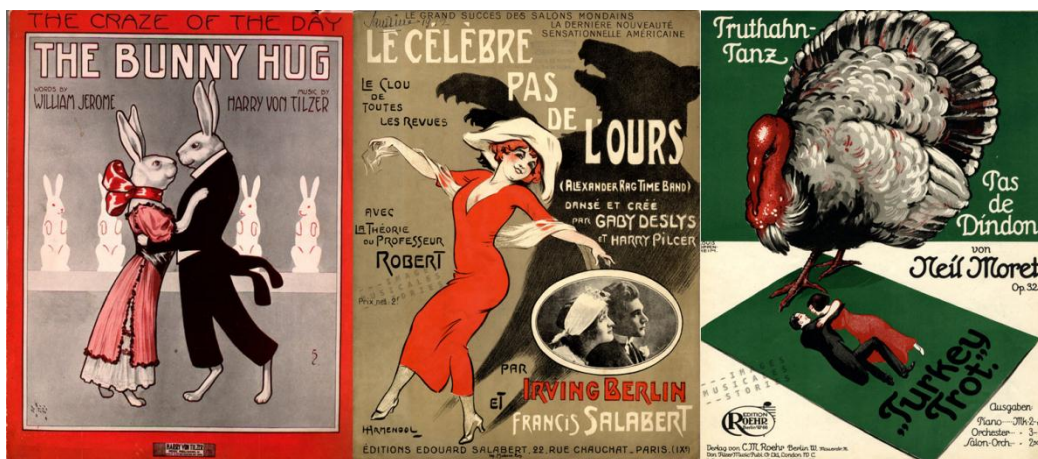
Figura 3 – Bunny Hug, Grizzly Bear e Turkey Trot

Os jovens, entretanto, não se importavam com essas críticas e, desse modo, o ragtime, rapidamente, cruzou as fronteiras de classe e raça. Segundo Savage (2009), os salões de dança eram lugares públicos em que os adolescentes podiam se encontrar sem a supervisão de adultos e onde as mulheres tinham liberdade para dançar com quem quisessem. Sendo assim, como Julian Street (1913, p. 10-11) 42 observou, as danças que imitavam animais tinham criado uma mistura social nunca antes sonhada nos EUA, “uma miscelânea heterogênea de pessoas em que respeitáveis mulheres jovens, casadas e solteiras, e até debutantes, dançam, não apenas sob o mesmo teto, mas na mesma sala, com mulheres da cidade” 43 .