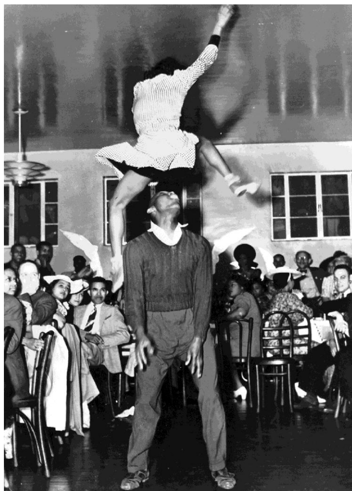
Figura 6 – Frankie Manning, inventor dos passos aéreos

Como observa Batiuchok (1988), alguns jovens foram se profissionalizando, era possível ganhar dinheiro em competições e trabalhar com dança em clubes e teatros. Assim, para muitos, o lindy hop virou um estilo de vida, já que era um entretenimento barato, além de uma fonte de renda. O Savoy, por exemplo, era a casa dos Whitey's Lindy Hoppers , dançarinos que reinaram como melhor grupo de lindy hop da segunda metade dos anos 1930 até meados dos anos 1940 (MANNING; MILLMAN, 2007). Segundo Caponi-Tabery (2008), foi com eles que o lindy ultrapassou os salões e começou a ser dançado também em teatros e cinemas. De acordo com Unruh (2012), suas performances espetaculares em filmes, como A Day at the Races (1937, EUA, WOOD) e Hellzapoppin' (1941, EUA, POTTER), teatros e salões por todo o mundo ajudaram a espalhar o lindy hop pelos mais diversos lugares dentro e fora dos EUA (MANNING; MILLMAN, 2007).