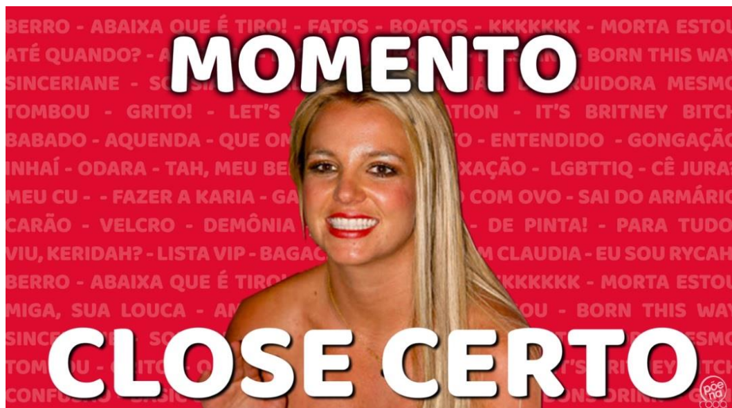
Figura 5: vinheta do quadro “Close certo”, voltada para notícias sobre ações em apoio à causa LGBT

Que a gente tenha cada vez mais héteros assim no mundo, não é verdade? Que apoiem a nossa luta, que tenham namorado a Britney [Spears], porque ela também merece ser feliz.