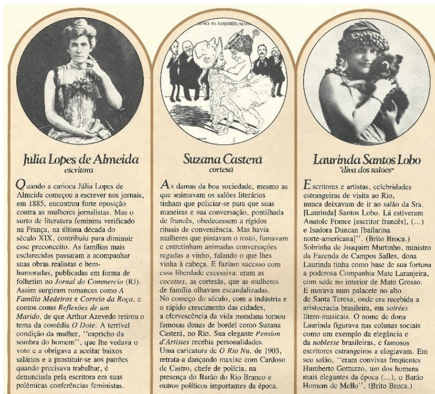
Figura 8 – Personagens femininas do início do século XX 68