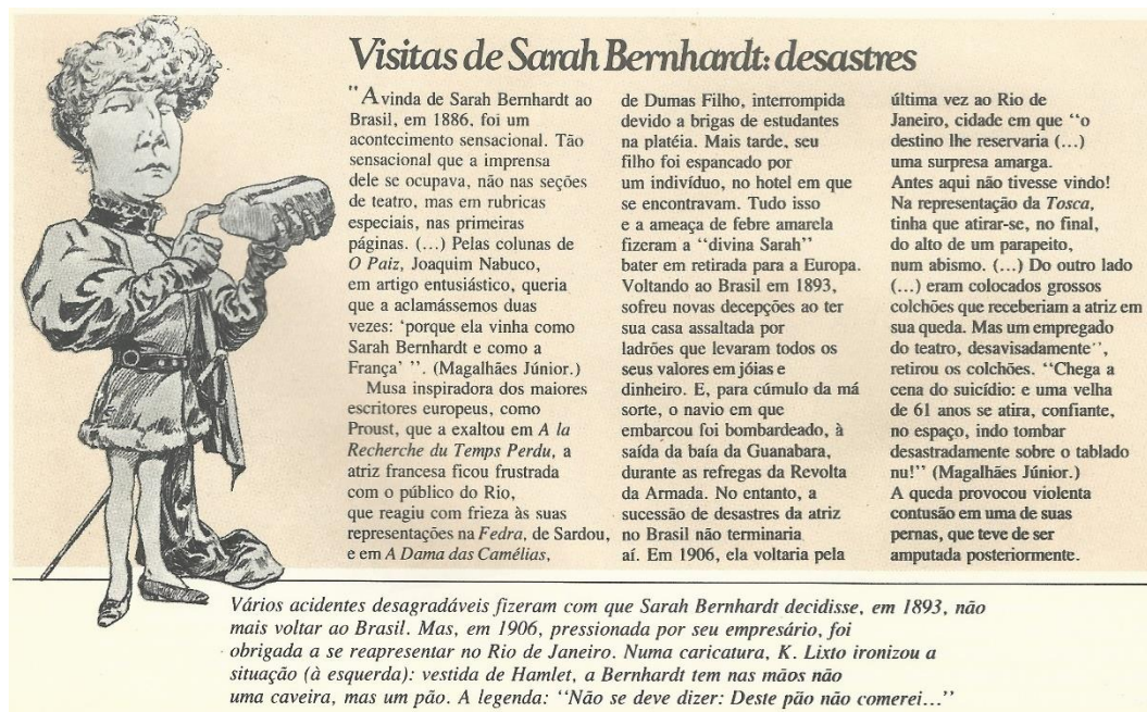
Figura 3 – Visitas de Sarah Bernhardt 38

Companhias de ópera italiana e alemãs vinham constantemente ao Rio de Janeiro atraídas pelos lucros que viriam de uma elite de fazendeiros e comerciantes. Os teatros brasileiros atraíam celebridades internacionais, como Isadora Duncan e Sarah Bernhardt. Esta última, considerada deusa dos teatros. A figura do box abaixo exemplifica a linha de pauta adotada pela Nosso Século quando aborda de maneira jocosa os “desastres” que permearam as visitas de Sarah Bernhardt ao Rio de Janeiro.