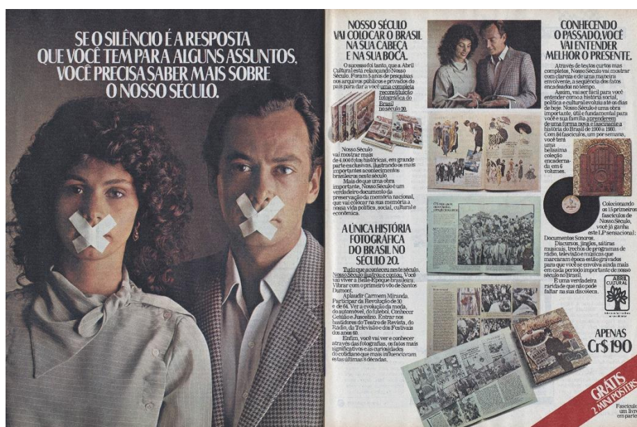
Figura 2 – Anúncio de relançamento da Nosso Século 30