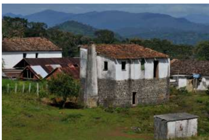
Figura 5: Fazenda Leolinda, Ilhéus – Bahia