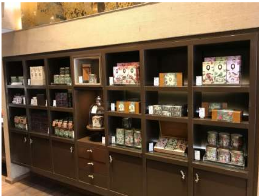
Figura 9: Disposição dos produtos no ambiente