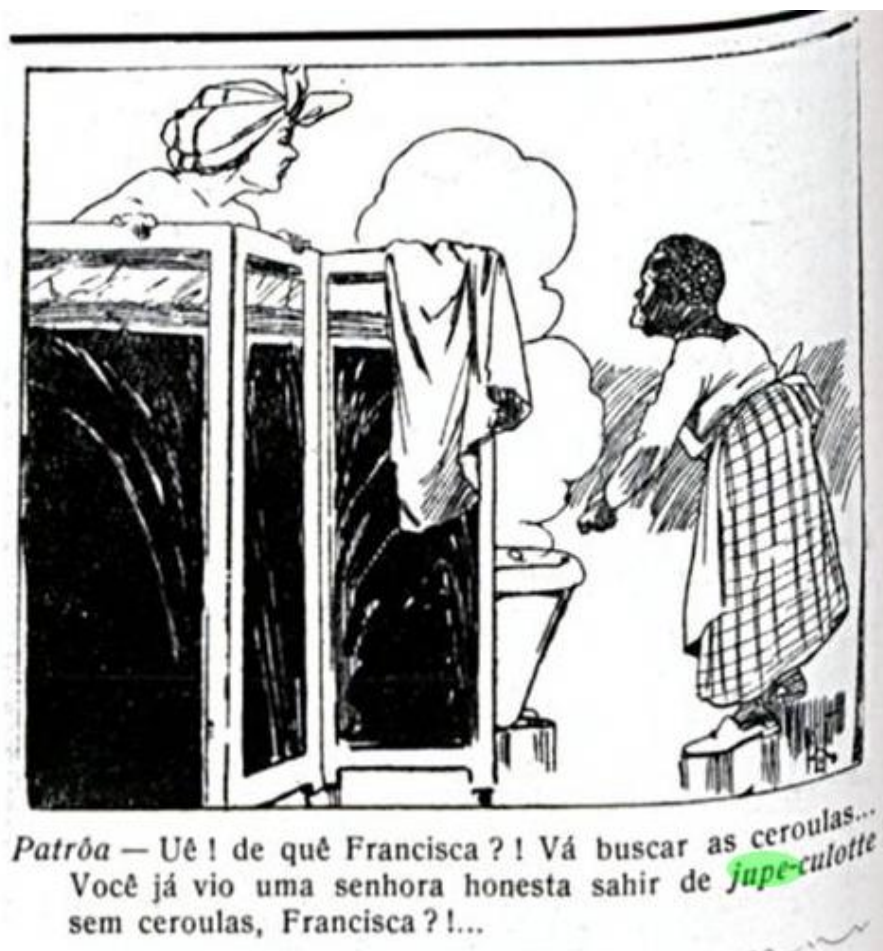
Figura 5. Charge. Fon-fon, 13 de maio de 1911, p.35.

Diferente da anterior, esta charge necessita do auxílio de uma legenda para ser entendida e provocar o riso dos leitores. Atrás de um boxe, uma mulher branca que acaba de tomar banho dirige-se à sua criada negra dizendo: “Você já viu uma senhora honesta sair de jupe-culotte sem ceroulas, Francisca?” O que se pretende dizer, na verdade, é que o uso de calças por mulheres seria tão ridículo quanto o uso de ceroulas. Ao apossar-se de um modelo de vestimenta que, até então era considerado predominantemente masculino, as mulheres estariam rompendo os limites de sua esfera de atuação para invadir o espaço dos homens, já que manter as demarcações entre os sexos era imprescindível para a manutenção do poder que os homens exerciam sobre as mulheres. Um trecho de uma conferência publicado na coluna Feminismos da revista ilumina nossa percepção do perigo que a igualdade entre os sexos, possibilitado, entre outras coisas, pelo uso da saia calção, podia representar para a manutenção do poder masculino sobre a mulher.