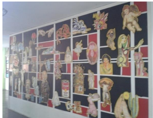
Fig. 20- Vista do mural do final para o início do mural do CH II