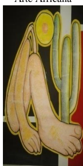
Tarsila do Amaral