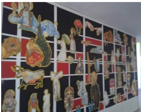
Fig. 19- Vista do início para o final do mural do CH II