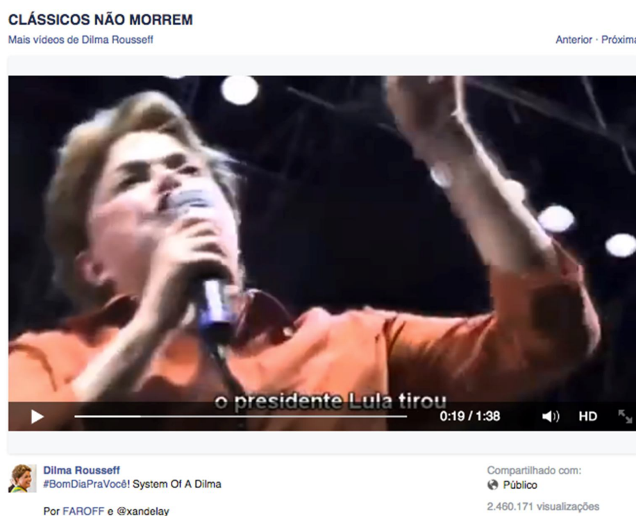
Figura 01 – Post do Facebook de Dilma Rousseff

Semanas antes da votação no segundo turno das eleições presidenciais de 2014 no Brasil, o clima entre os candidatos Dilma Rousseff e Aécio Neves estava acirrado e a internet era um dos principais campos de batalha pelos votos dos eleitores. 13 dias antes da votação, exatamente no dia 13 de outubro, enquanto se espalhavam pelas redes sociais vídeos de campanha, infográficos, reportagens e materiais de apoio e críticas aos candidatos, o perfil oficial da presidenta Dilma postou a seguinte mensagem 1 :