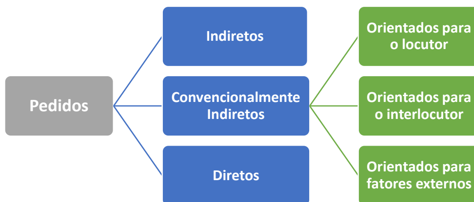
Figura 2: Nova categorização geral de pedidos [Adaptação da categorização de Trosborg (1995) por Silva (2017)]

convencionalmente indiretos orientados para o locutor, verificamos a ocorrência de pedidos construídos com possível referência a fatores externos, como normas e planejamentos adotados pelas instituições acadêmicas. Desse modo, optamos por incluir uma nova categoria de pedidos convencionalmente indiretos, que denominamos pedidos convencionalmente indiretos orientados para fatores externos , ilustrada na figura a seguir: