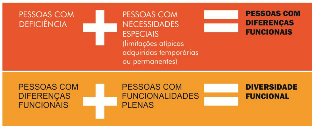
Figura 1.1: Representação gráfica dos termos ‘Diferença Funcional’ e ‘Diversidade Funcional’.

O Design Inclusivo, também conhecido como ‘Design para todos’ e ‘Design Universal’, procura evitar a necessidade de ambientes e produtos exclusivos para as pessoas com diferenças funcionais, no sentido de assegurar que todos possam utilizar todos os componentes do ambiente e todos os produtos. A proposta é ampliar o público destinatário do projeto, considerando características, vivências e necessidades tanto dos grupos dominantes como dos minoritários, ou seja, favorecendo a diversidade funcional humana natural e contribuindo para melhorias da qualidade de vida para todos.