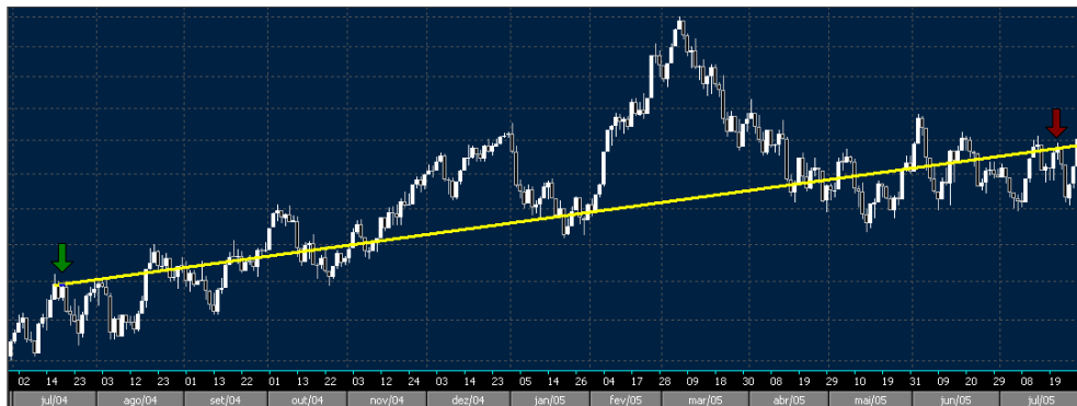
Figura 20 - Desempenho do Índice BOVESPA no período de 15/07/2004 a 14/07/2005.

Os testes foram realizados a partir do período de 15/07/2004 até 15/07/2005 para uma lista que compreende 30 ativos que apresentam tendências distintas de alta e baixa, bem como volume e padrões gráficos diferentes. O objetivo desses testes é verificar se os agentes realmente são capazes de escolher as melhores opções de compra e venda quando existem mais opções de investimento. O montante disponibilizado para cada agente foi de R$ 200.000,00 e não existem limitações para investimento, desde que o valor investido não ultrapasse os montantes disponíveis para cada agente. O rendimento total da bolsa de valores nesse período foi de aproximadamente 15%. A figura abaixo indica esse rendimento de acordo com a linha amarela iniciada no ponto identificado pela seta verde (15/07/2004) e finalizada no ponto identificado pela seta vermelha (14/07/2005). O índice se encontra em tendência de alta, com picos no início do ano. Investidores que utilizam técnicas mais aplicadas deveriam obter ganhos acima do rendimento total calculado no período.