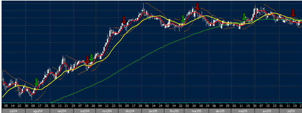
Figura 19 - Desempenho do Agente Klaus.

Ao analisar a tabela e a Figura 19 é possível constatar que nem todas as operações foram bem sucedidas, mesmo as que resultaram em lucro. O objetivo é o mesmo do agente Johnny, ganhar mais do que se perde, mas nesse caso observa-se que o agente investidor em questão não se manteve com perdas abaixo de 3% e não conseguiu alcançar os lucros obtidos pelo primeiro agente apresentado.