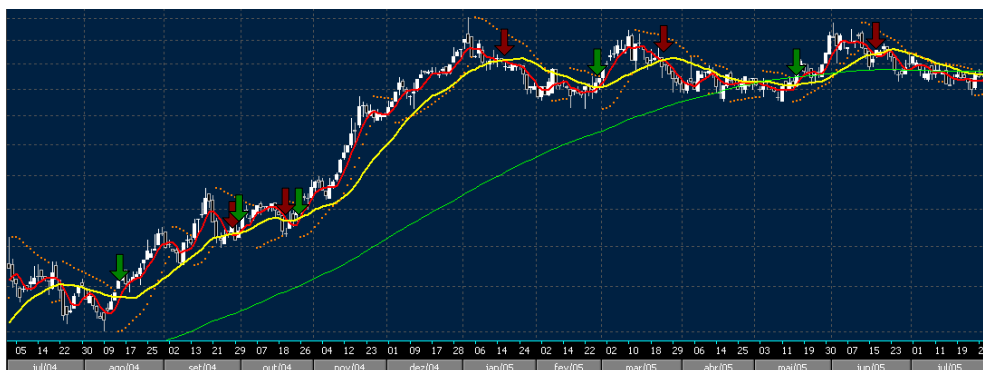
Figura 18 - Desempenho do Agente Johnny.

A figura abaixo representa o gráfico de candles, com as marcações de indicação de compra (setas verdes) e de venda (setas vermelhas), SAR (em laranja), tendência de alta (verde), médias de 5 (em vermelho) e 21 (em amarelo) exibidas.