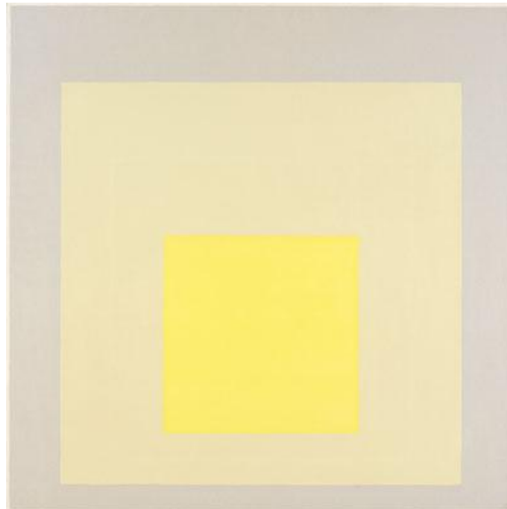
Figura 1. Josef Albers, Homage to the Square, Amalgamating , 1971. Óleo sobre aglomerado de madeira, 101.6 x 101.6 cm. ©2007 The Josef and Anni Albers Foundation / Artists Rights Society (ARS), New York.

Nas suas duas grandes séries –as Homenagens ao Quadrado e as Constelações Estruturais – Josef Albers destaca os elementos mais discretos, fazendo todos vibrarem. Albers persegue o entre , o não dito , o silêncio, o não visto , o marginal, o esquecido. Ou, em suas próprias palavras: “as qualidades remanescentes, intermediárias, subtrativas, tornadas ativas”.