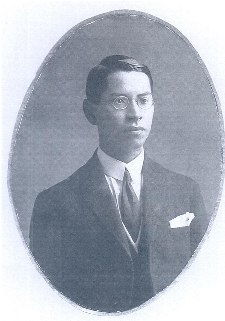
Arquivo da família ( 1908)