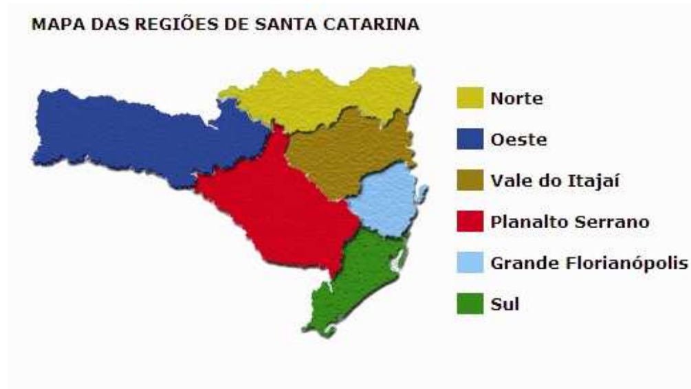
Figura 1 – Regiões do Estado de Santa Catarina.

que apresentam produção econômica bastante diversificada. Cada região é especializada num determinado segmento da indústria, mas as empresas do vestuário estão presentes em todas as regiões. Santa Catarina é o segundo polo produtor têxtil/vestuário do Brasil com influência no cenário da moda.