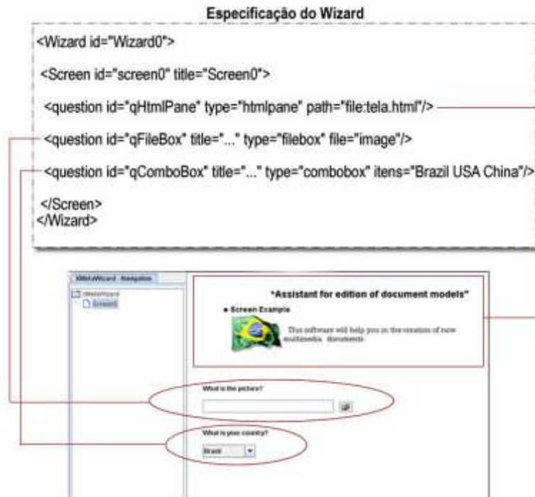
Figura 30. Exemplo de especificação XWizard e a respectiva interface gerada.

É conveniente ressaltar, com o propósito de evitar confusão de termos, que os templates são representados e armazenados pela ferramenta NCLWizard como documentos NCL convencionais ou como documentos TAL. Suponha um template, bastante simples, que representa programas em que o espectador decide qual final, entre duas alternativas diferentes, ele deseja assistir. A estrutura do template é composta por um vídeo principal, ao final do qual é exibida uma pergunta com duas opções que permitem ao espectador decidir assistir a um dos dois vídeos finais. Essa estrutura não é alterada entre instâncias de documentos desse template. O que muda é o conteúdo dos vídeos finais e das imagens que compõem a pergunta e botões de opção. Nesse caso, é suficiente utilizar um documento NCL para representar o template. O autor desse template poderia ainda expressá-lo com um número variável de finais, caso em que a quantidade de vídeos e imagens de finais se tornaria variável. Para expressar templates dessa natureza dinâmica (a maioria deles), a ferramenta faz uso de especificações em TAL.