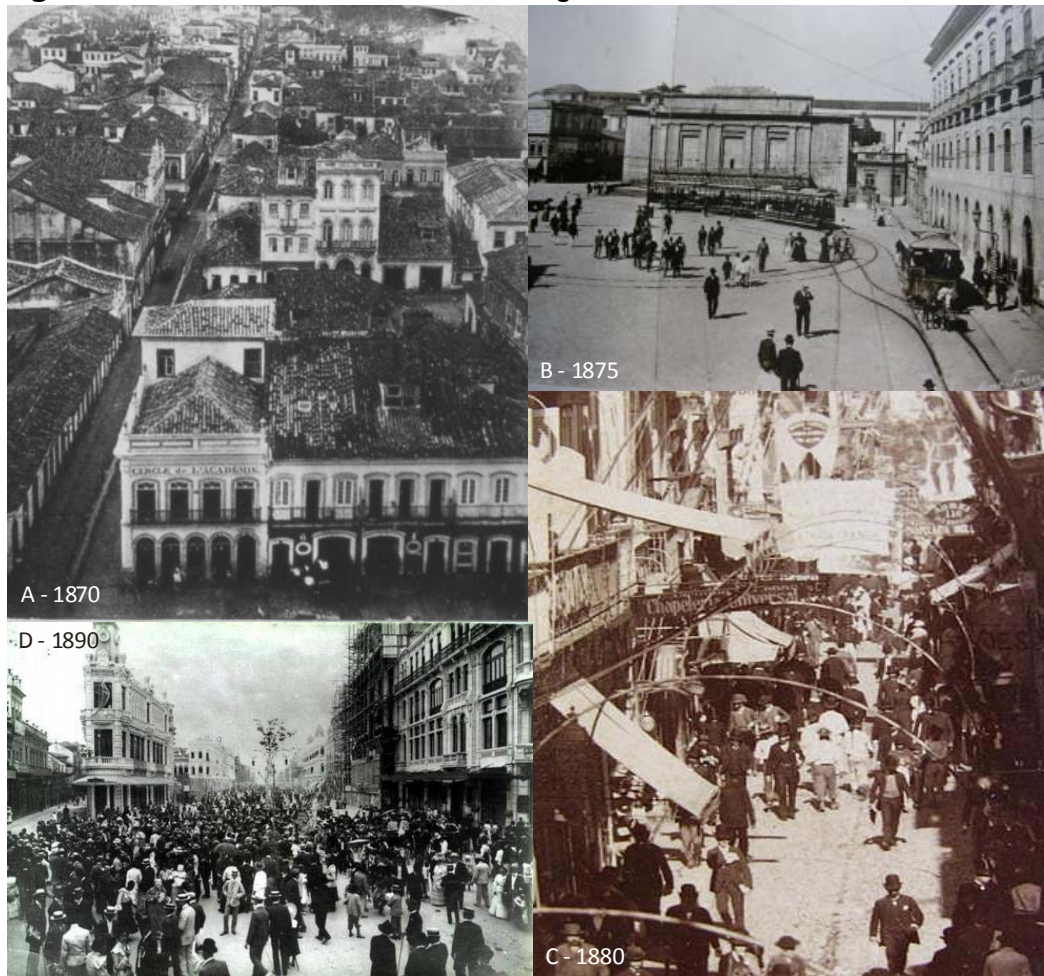
Figura 6 – Centro urbano do Rio na segunda metade do século XIX