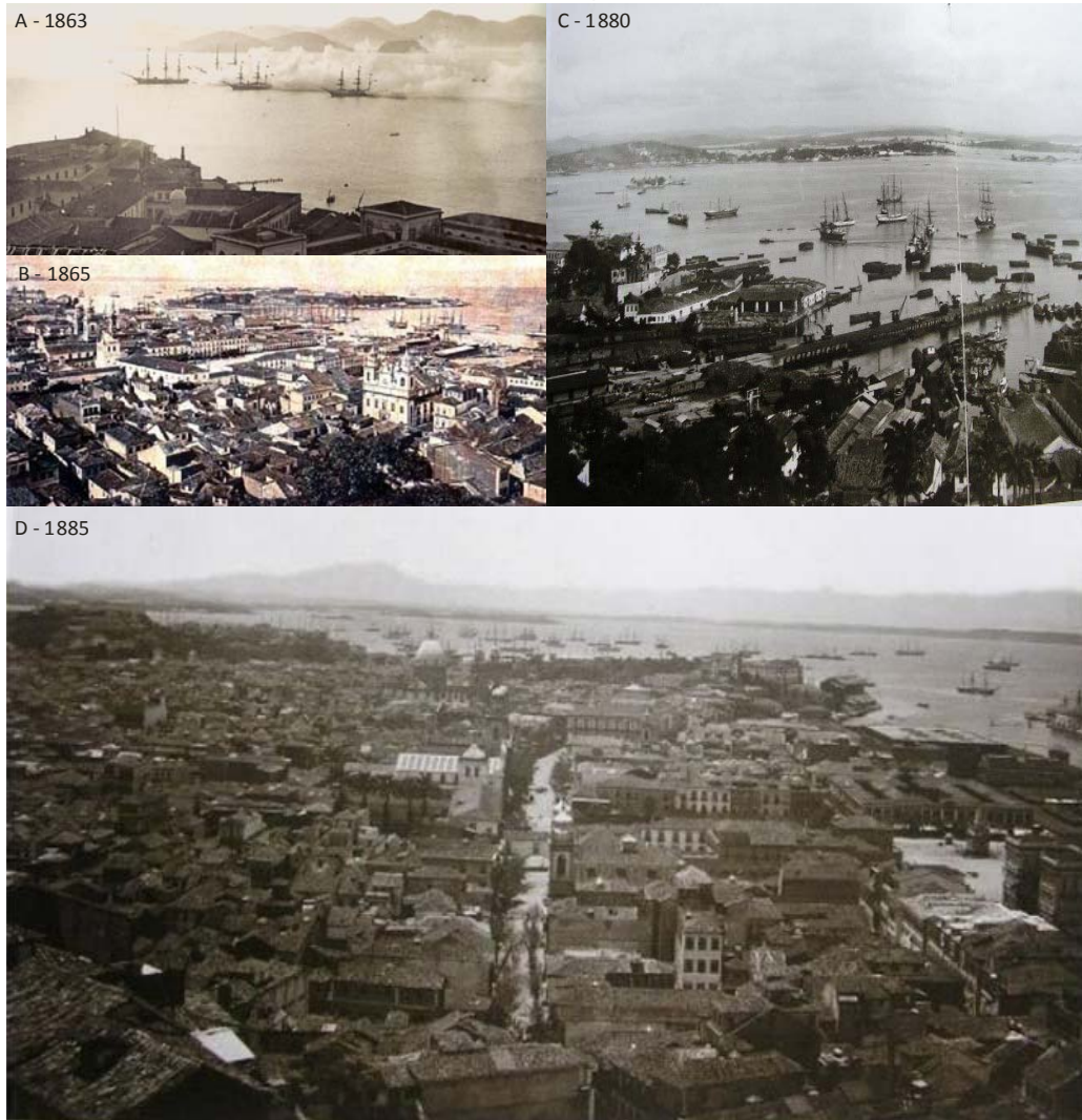
Figura 5 – Centro e porto do Rio na segunda metade do século XIX