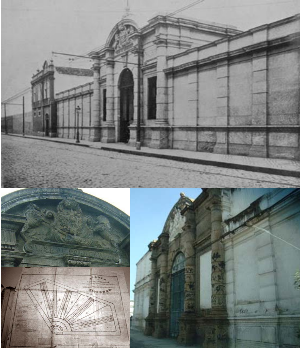
Figura 4 – Casa de Detenção e Correção do Rio de Janeiro