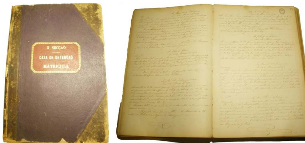
Figura 2 – Casa de Detenção/matricula, ofícios e requerimentos