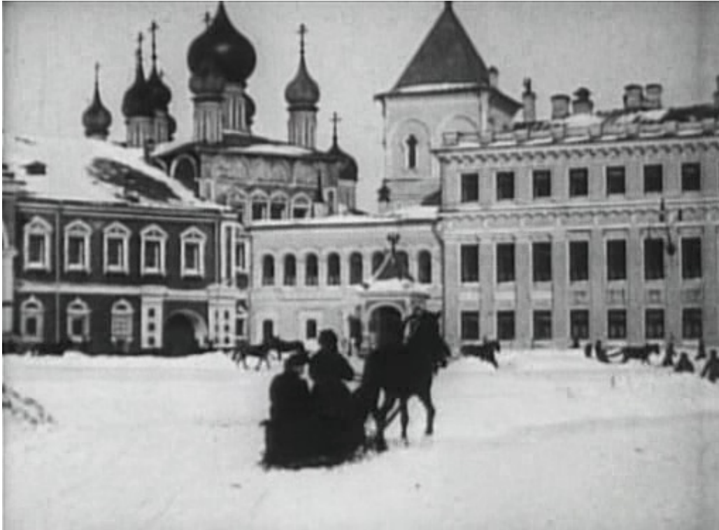
1.v Moscow clad in snow – de Pathé Frères, de 1908

Machado atribui o efeito de sua autenticidade em parte aos notáveis cenários (que às vezes incorporam elementos dos edifícios Pathé, em Vincennes) e dos cenários criados especialmente pelo artista Lorant Heilbron. Por outro lado, parece claro que o efeito de autenticidade se deve a introdução de planos de atualidade em um contexto composto. Alguns exemplos que fazem parte desta série: Au Pays Noir (Nonguer, 1905), Au Bagne (Nonguer, 1905), La Corvée , La Mutinerie , L' Evasion (que apresenta vários quadros filmados em exteriores reais) e L' Execution .