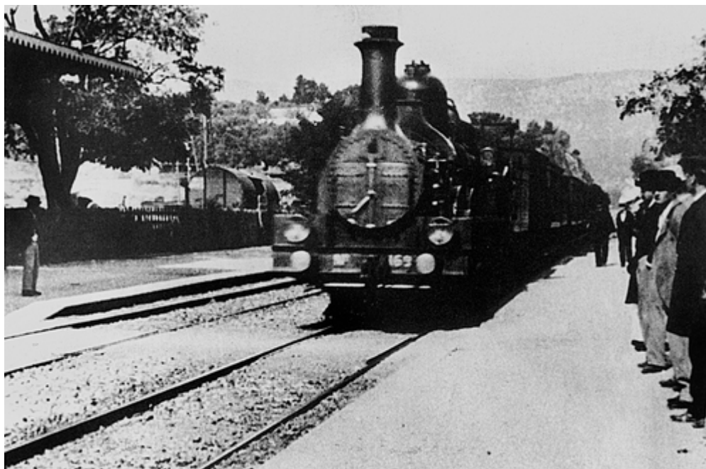
1.ii L'arrivée d'un train em gare de la Ciotat (1895) Lumière

Philippe Dubois, que dedicou um artigo inteiro para discutir o filme L'Arrive d'un train em gare de La Ciotat , faz outras considerações. Para ele este filme de Lumière coloca em jogo um conjunto de questões fundamentais para o funcionamento do cinema: a questão do ponto de vista (único), do enquadramento (local escolhido), da profundidade de campo (Lumière utilizou uma objetiva que permitia uma grande profundidade de campo – que ia do primeiro plano ao infinito), questão do plano (que vai do plano geral ao plano médio), a questão do movimento (o travelling inverso) e os deslocamentos na lateralidade, a questão da seqüência (continuidade e descontinuidade do plano, separação, ligação) e a questão da montagem (o plano-seqüência como montagem de plano, constituição do ponto de vista).