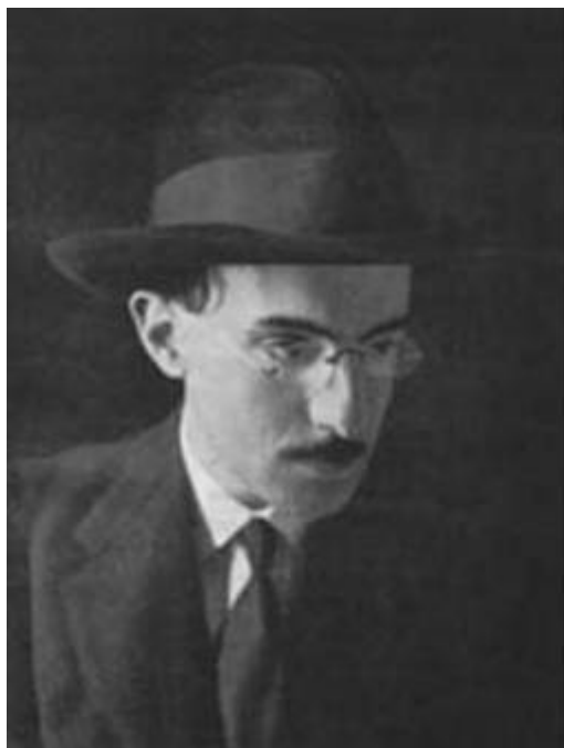
Fernando Antonio Nogueira Pessoa (1888 – 1935)