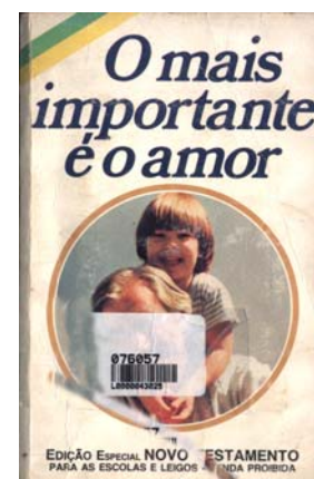
Figura 2 . Página do Novo Testamento “O mais importante é o amor”, de 1972.