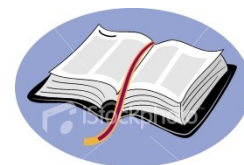
Figura 1 . As três primeiras imagens encontradas nos principais sites de busca na Internet ao digitar-se “ bible clipart ”. Esse tipo de desenho, ao simplificar as imagens reafirma a idéia comum que se tem da Bíblia Sagrada.