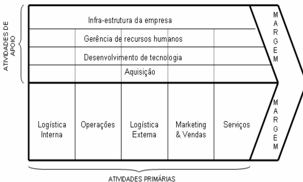
Figura 3: Cadeia de valor de Porter.

A Figura 3 ilustra a cadeia de valor, segundo a visão de Porter (1985).